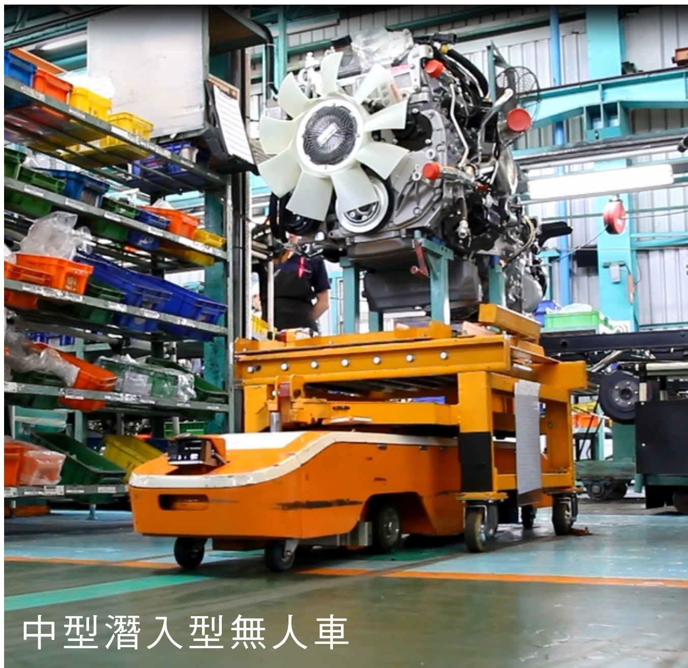
中型潛入型無人車